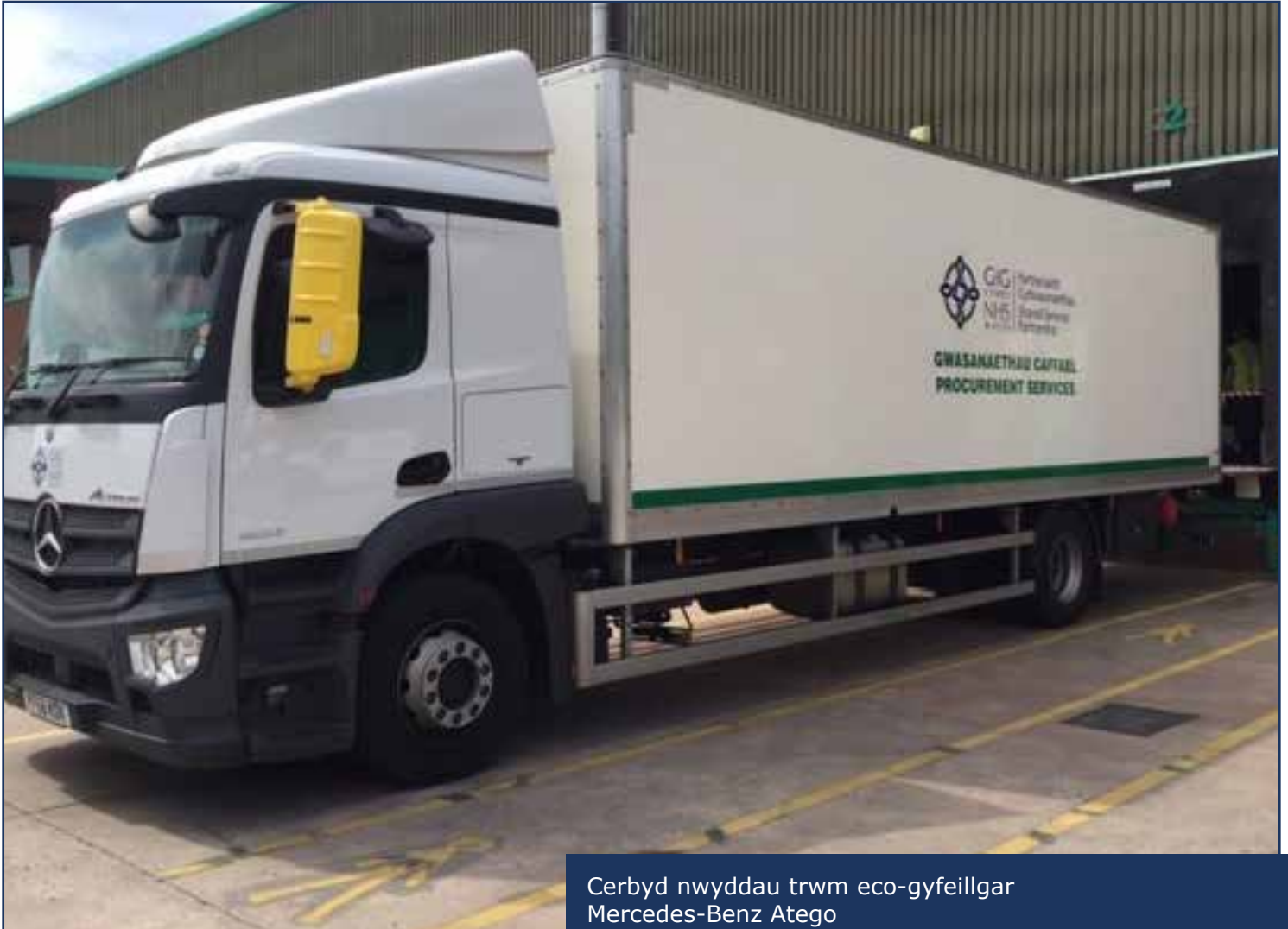
Cerbyd nwyddau trwm eco-gyfeillgar Mercedes-Benz Atego

Mae Cadwyn Gyflenwi, Gwasanaethau Caffael, yn ymrwymedig i reoli ei heffaith amgylcheddol gan leihau ei hôl-troed carbon a chynyddu cynaliadwyedd. Fel allbwn uniongyrchol adolygiad diweddar o Storfeydd Rhanbarthol Dinbych, Amserlen Trafnidiaeth Ddyddiol Gogledd-orllewin Cymru, nodwyd bod cyfle i leihau ôl-troed carbon a chostau gweithredu.